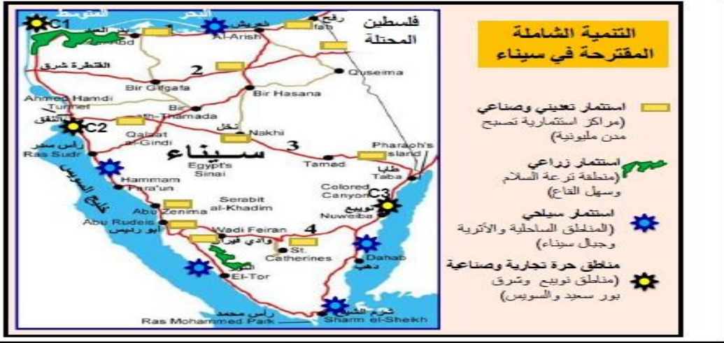
خريطة توضح مواقع وتنوع التنمية الشاملة في سيناء