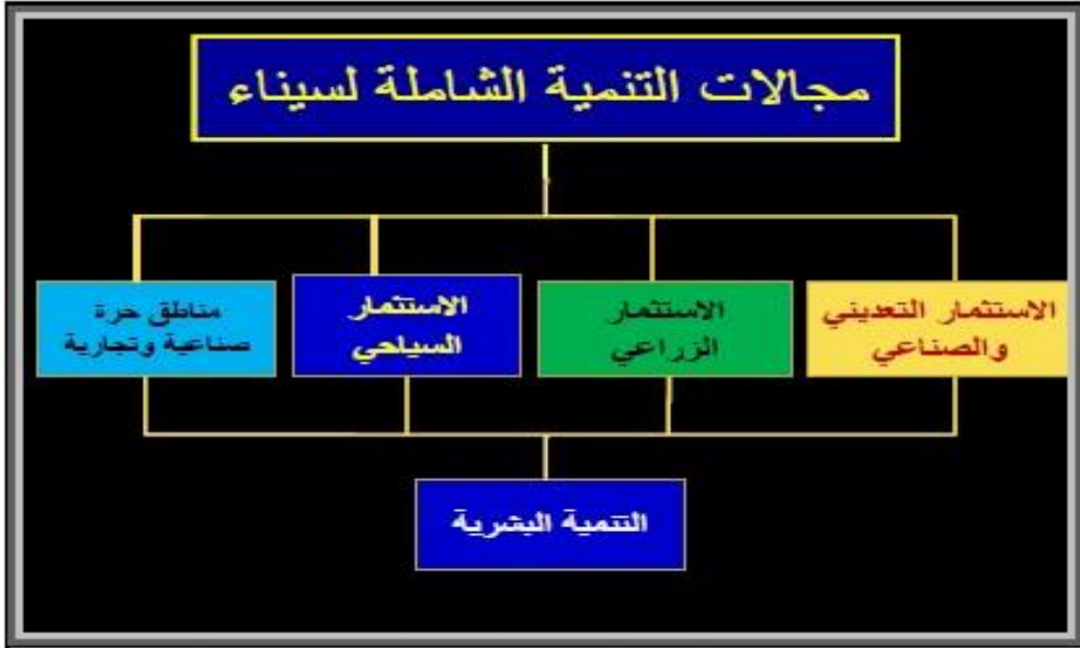
مجالات التنمية الشاملة المقترحة والممكنة في سيناء